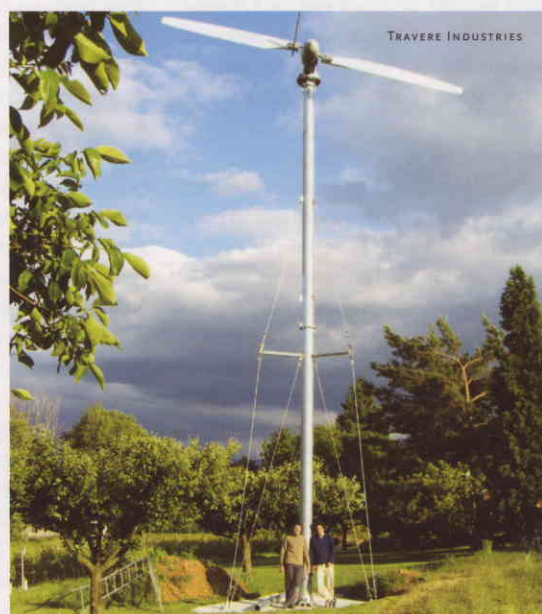
Modèle TA 7.2 de Traver Industries de 7,5 kW.

Une fois posée ces données objectives, le travail d'étude du potentiel éolien du site peut commencer. Il s'agit de