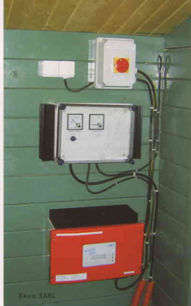
Système d'injection réseau comprenant de haut en bas : boîtier de sectionnement aux normes EDF, contrôleur de tension et onduleur.

Auton'home productions à Missillac (Loire-Atlantique), a décidé de se recentrer sur ses autres activités, comme le solaire : « Il y a trop de blocages au niveau des maires, de la DDE, de la Drire... Les chiffres parlent d'eux-mêmes : depuis notre installation, il y a six ans, nous avons enregistré quelque 1 750 demandes par an, monté 150 dossiers de pré-études, déposé 46 demandes de permis de construire et vendu... 6 éoliennes ! On ne peut pas vivre comme ça avec aussi peu de rentrées. »